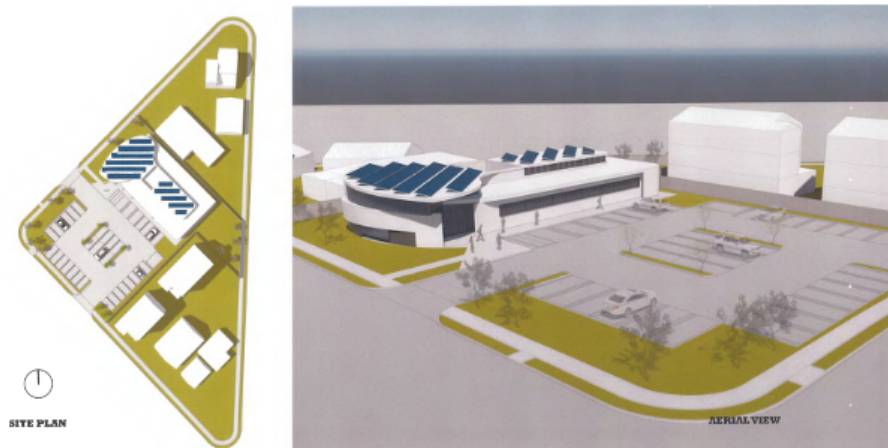
Fig 2, Vista aérea y plano del sitio del Centro Integral de Desarrollo de La Puente.