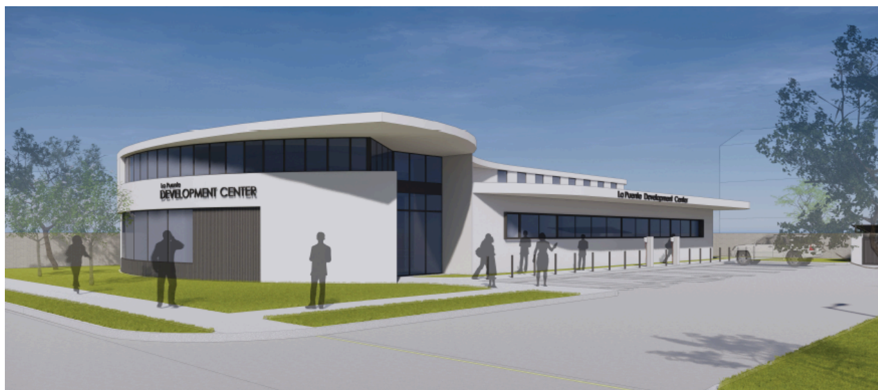
Fig 1, Centro Integral de La Puente con mural en el exterior

https://apply-lacdac.smapply.io/prog/la_puente_one_stop_development_center/