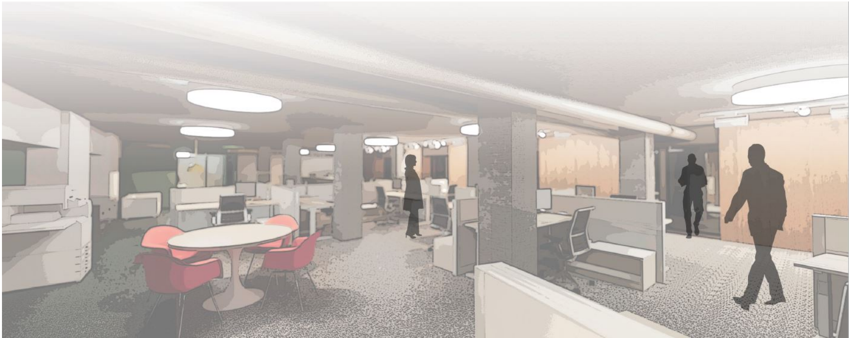
1. Representación de la Sala de Registros – Oficina del Defensor Público – 6º. piso

Presente la solicitud en línea: https://apply-lacdac.smapply.io/prog/hall_of_records_-_public_defender_office_6th_floor/